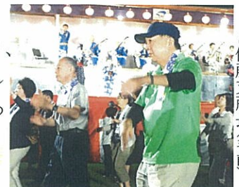
相模名誉会長(奥)と佐藤支所長(手前)