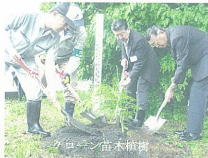
クローン苗木植樹

私も植樹に参加させて頂きまして、今後植えられた苗木が地域の皆様方に育てられ、大きく成長することを楽しみにしております。