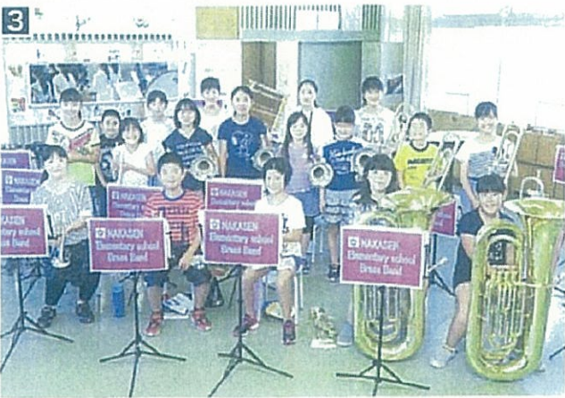
広報だいせん9月1日号より

第25回秋田県小学校バンドフェスティバルが7月22～23日秋田県民会館で行われ全県から46校が出場した。中仙小学校は金賞を獲得し、10月29日に岩手県奥州市で行われる東北大会に出場する。銅賞は大仙市立四ツ屋小学校と秋田市立勝平小学校、銀賞は該当校なし。