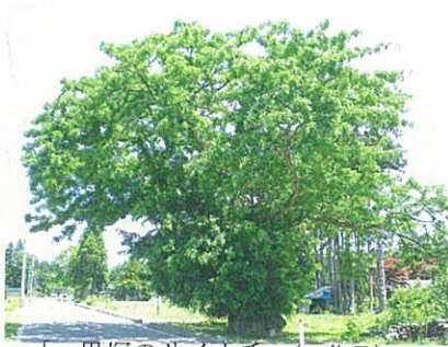
「一里塚のサイカチ」(1代目)

当日は朝から雨模様の中、森林総合研究所林木育種センター東北育種場、地元出身の市議会議員、大仙市中仙支所、大仙市教育委員会中仙分室、そして地元