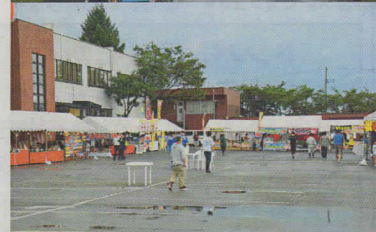
虹がかかりました