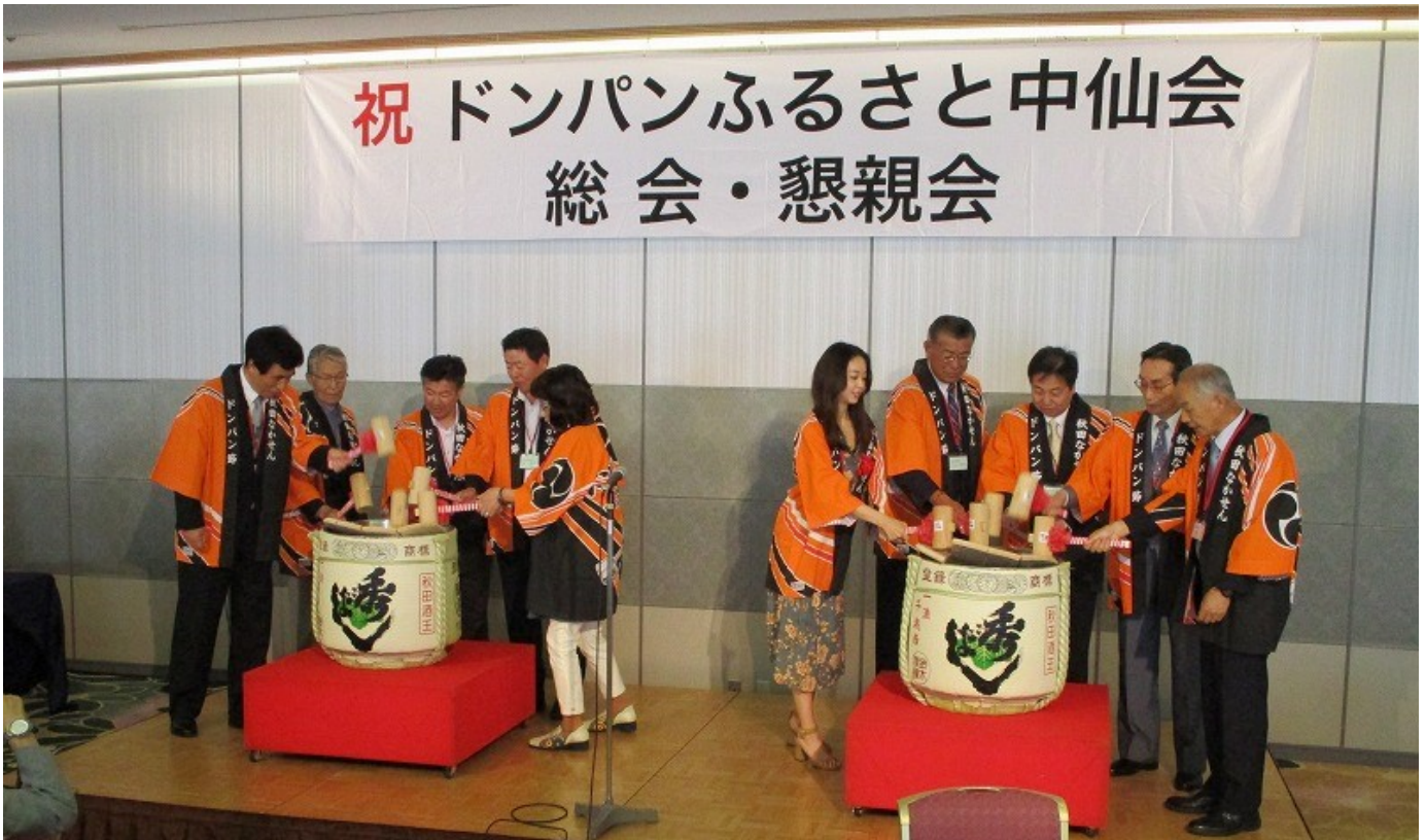
乾杯挨拶 秩父議員