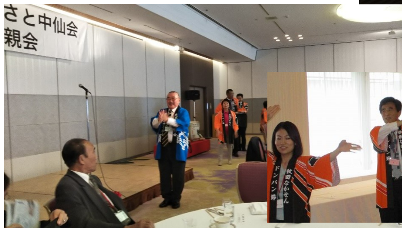
その次はロックドンパン