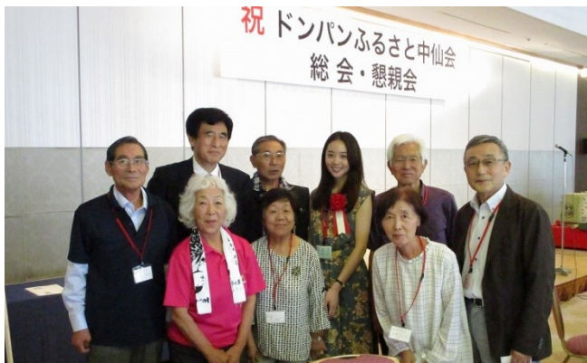
ドンパン踊りが始まりました